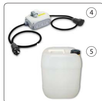
Master-slave kontrol og klæbemiddel XF10